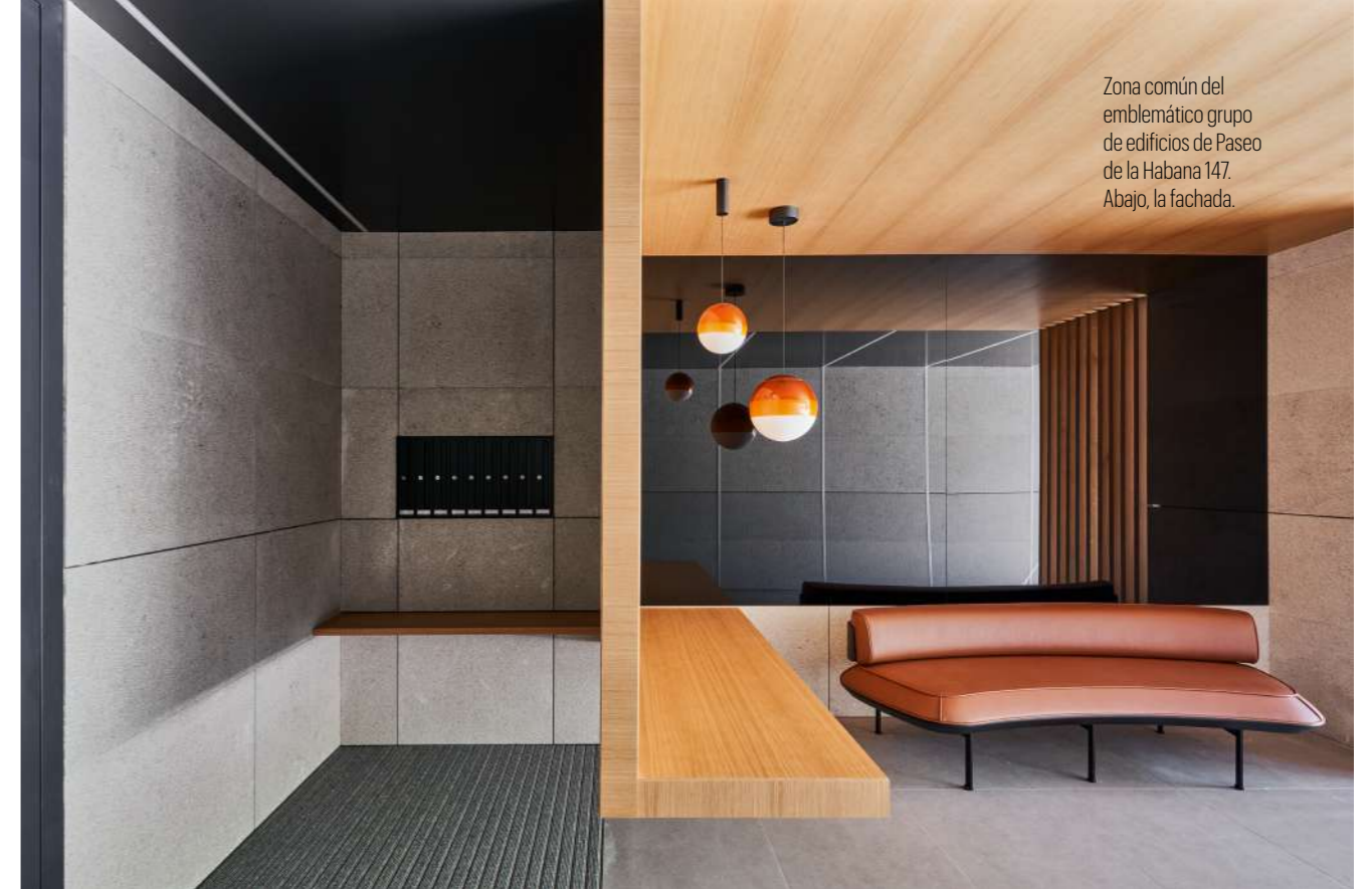
Zona común del emblemático grupo de edificios de Paseo de la Habana 147. Abajo, la fachada.