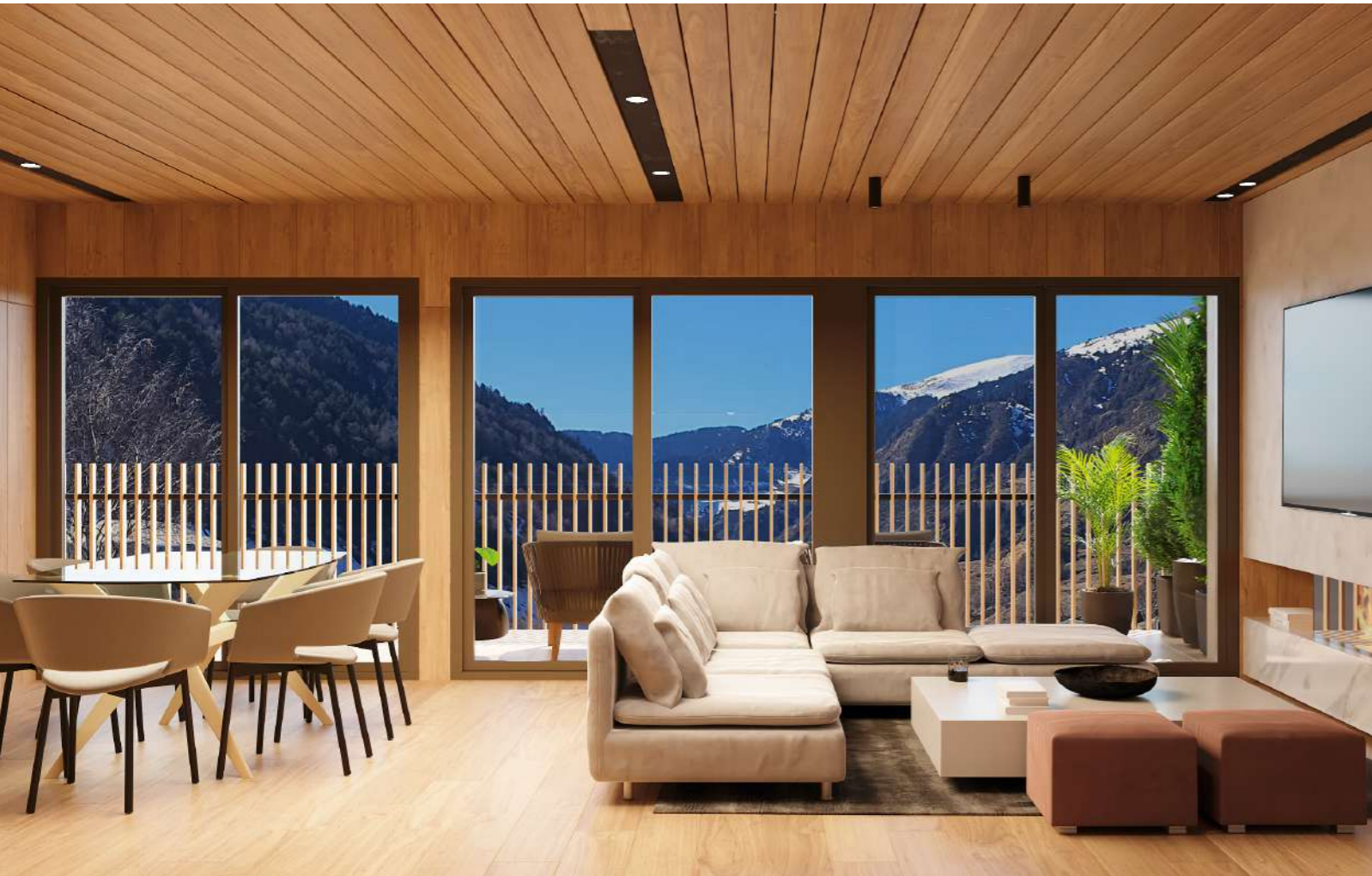
El salón de una de las 49 viviendas de lujo de la urbanización Arbres El Tarter, en Andorra.