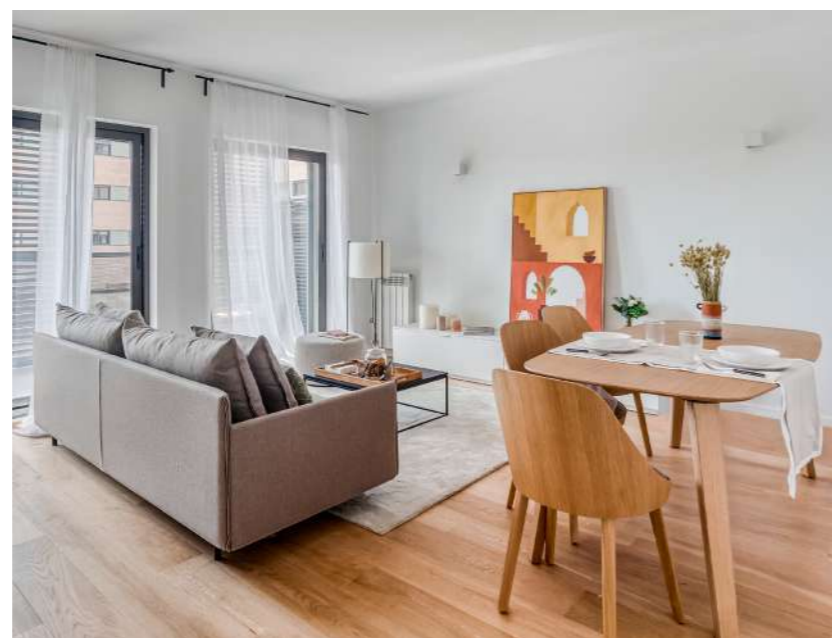
Arriba, interior de la promoción Bell Sarrià; abajo, salón de uno de los apartamentos de Crecca Volpelleres, ambas en Barcelona.

Aires de cambio, para bien, soplan en el sector inmobiliario desde la llegada de la pandemia a nuestras vidas. Si antes el hogar era, para algunos, un mero contenedor de pertenencias en el que pasar las noches y los ratos muertos, ahora el cariño y el tiempo invertidos en encontrar el nido perfecto se han multiplicado. Y lo cierto es que ya tocaba. “El 40% de los españoles confiesa plantearse cambiar de vivienda tras la situación que hemos vivido”, nos cuentan desde Culmia, una promotora e inmobiliaria que se extiende por todo el país y que pone el foco en viviendas asequibles, tanto en presupuestos como en prestaciones. “Como sociedad priorizamos domicilios más espaciosos y con zonas comunes como piscinas, parques infantiles, jardines o incluso salas de teletrabajo”, apuntan. En su empeño por acompañar al cliente en esa búsqueda, Culmia ha desarrollado una guía para el comprador –ya sea primerizo o reincidente– con la que arrojar luz sobre los entresijos de un mercado que a veces puede llegar a imponer a quien no lo conoce: “Entendemos el proceso de adquirir una casa de esta forma: asesorar desde el momento en el que se tiene conciencia de la necesidad de compra hasta la firma de la propiedad”. CULMIA.COM